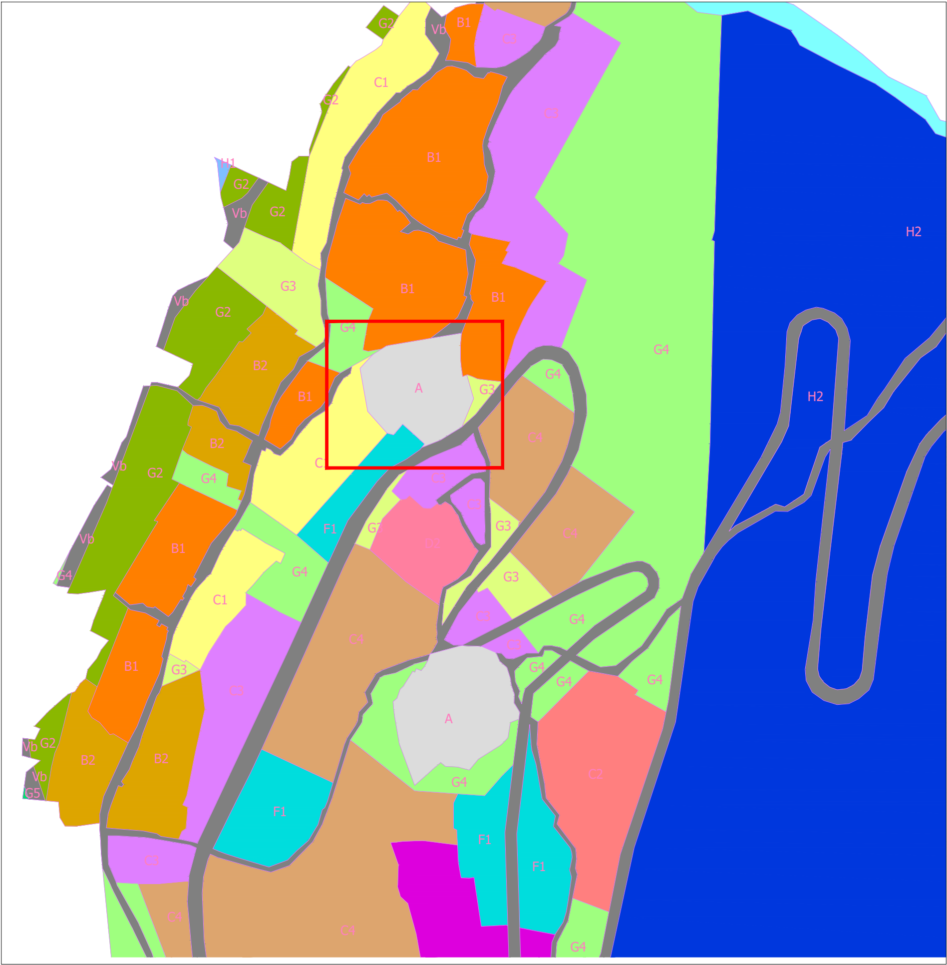
PIANO REGIONALE PAESISTICO | Scala 1:10000