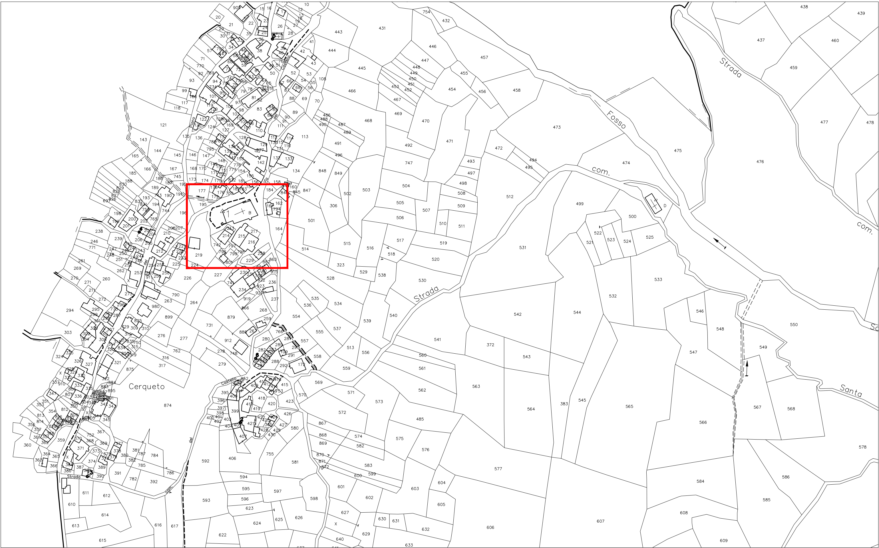
PLANIMETRIA GENERALE CATASTALE | Scala 1:2000